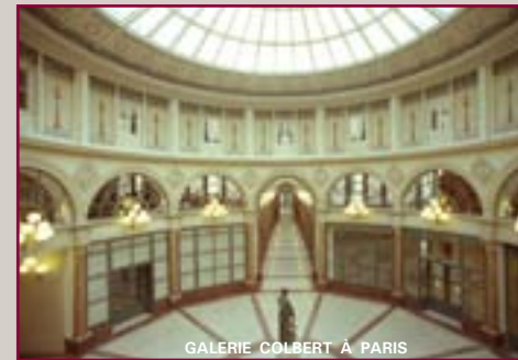
GALERIE COLBERT À PARIS