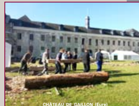
CHÂTEAU DE GAILLON (Eure)

L'offre de formation permanente de l'Institut national du patrimoine