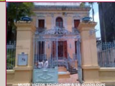
MUSÉE VICTOR SCHOELCHER À LA GUADELOUPE